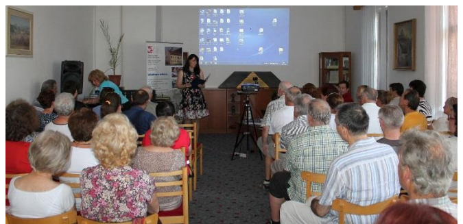
Seminár Okno nielen do archeológie v rámci sympózia Ora et Ars