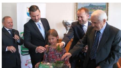
Vo verejnej knižnici slávnostne uviedli KRONIKU TRENČIANSKEHO FUTBALU

Trenčiansky futbal opäť zažiaril. Tento raz však nebodoval na ihrisku, ale na pôde Verejnej knižnice Michala Rešetku v Trenčíne, kde predstavili publikáciu 110 rokov trenčianskeho futbalu.