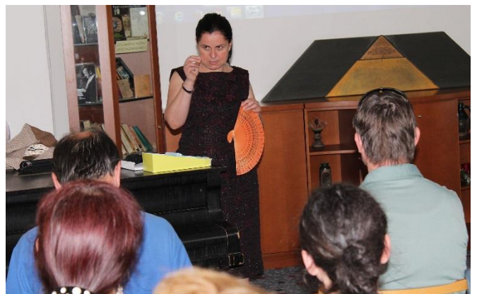
Srí Lanka očami cestovateľky Ireny Chrapanovej